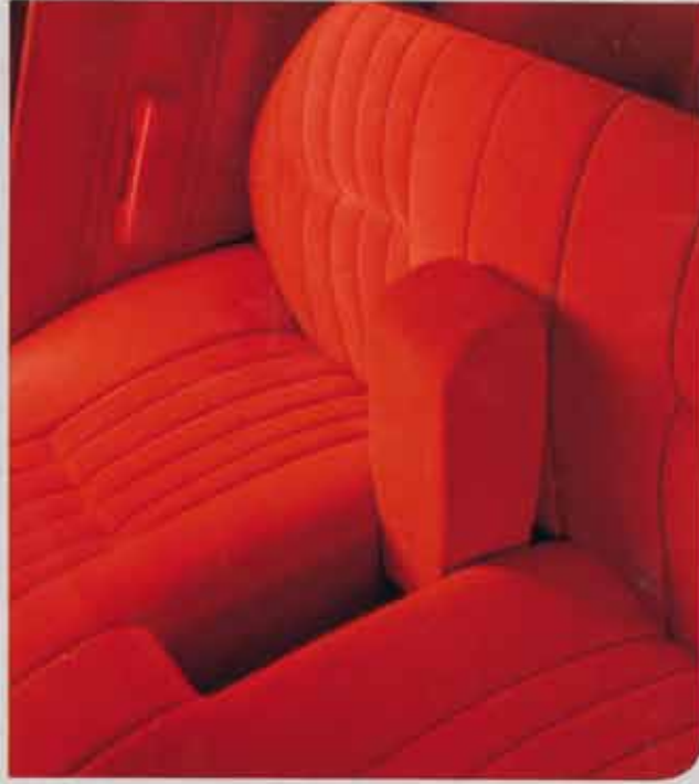
Windsor stoelbekleding en een neerklapbare middenarmsteun in de rugleuning van de achterbank.