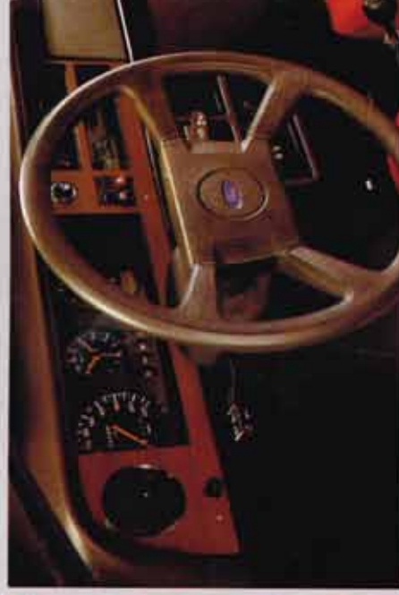
4-spaaks stuurwiel; met hout afgewerkt dashboard met klok en dagteller; afsluitbaar handschoenenkastje met verlichting. (Radio tegen meerprijs).

Een compleet overzicht van de standaard-uitrusting vindt u op de uitklapbare achterpagina.