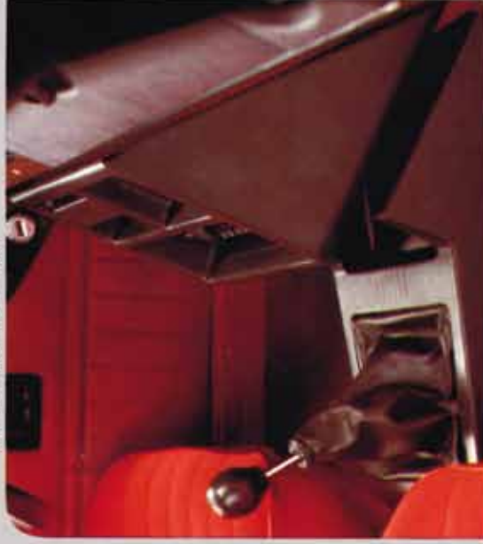
Luxe midden-konsole met gescheiden opbergvakken. (Radio tegen meerprijs.)

De reeds doeltreffende verwarming en ventilatie zijn nu aangevuld met een nieuw ventilatie-rooster voor frisse lucht centraal in het dashboard geplaatst; uit de buitenste ventilatie-roosters kan nu warme lucht worden geblazen voor het ontwasemen van de zijramen.