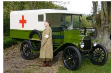
MRB vrijstelling als oldtimer en als ambulance

Oldtimers zijn mobiel erfgoed op de weg en zijn geen onderdeel van de reguliere mobiliteit. Oldtimers rijden maar heel weinig. De vrijstelling is recent nog fors versoberd. Deze argumenten om de vrijstelling niet te veranderen heeft de FEHAC inmiddels ingebracht bij de staatssecretaris en bij de vaste Tweede Kamer commissie van financiën.