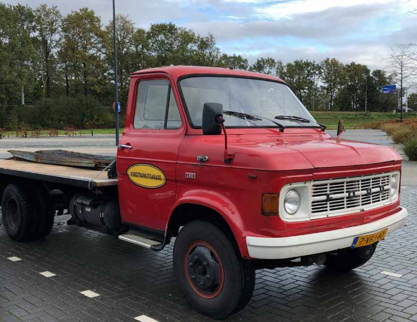
BEURS LEEUWARDEN 2019