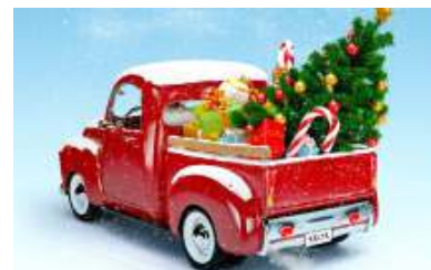
De FEHAC wenst u een goed en pechvrij 2020

Het kan zijn dat u voor het eerst kennismaakt met het blad van FEHAC, de FEHACtiviteiten. Met ingang van dit nummer verspreiden we het blad ruimer onder relaties en bestuursleden van de aangesloten clubs.