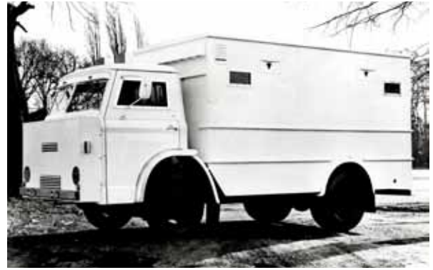
Amoured Een zwaar gepantserde D300, die werd ingezet om overvallers in Zambia het moeilijk te maken de wekelijkse lonen te beschermen.