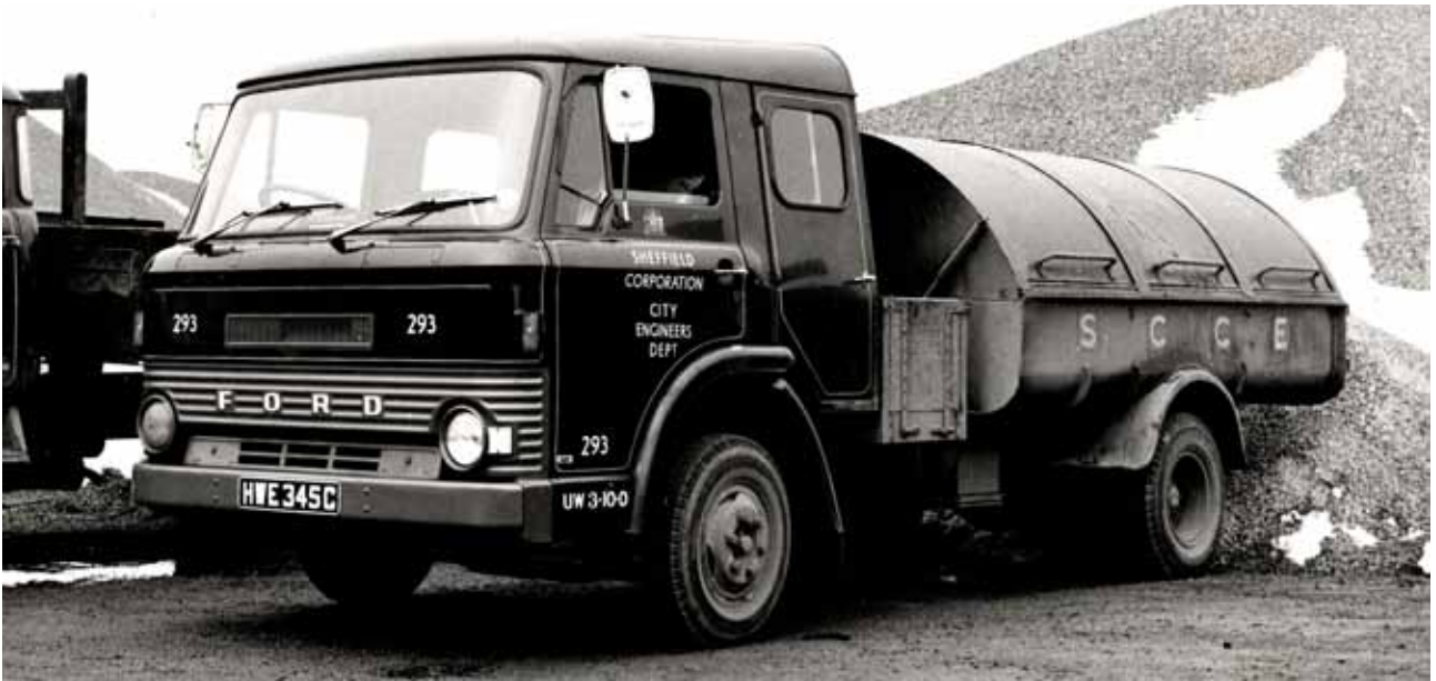
Refuse: Een vuilniswagen, die in het Engels een refuse collector heet op basis van een D300