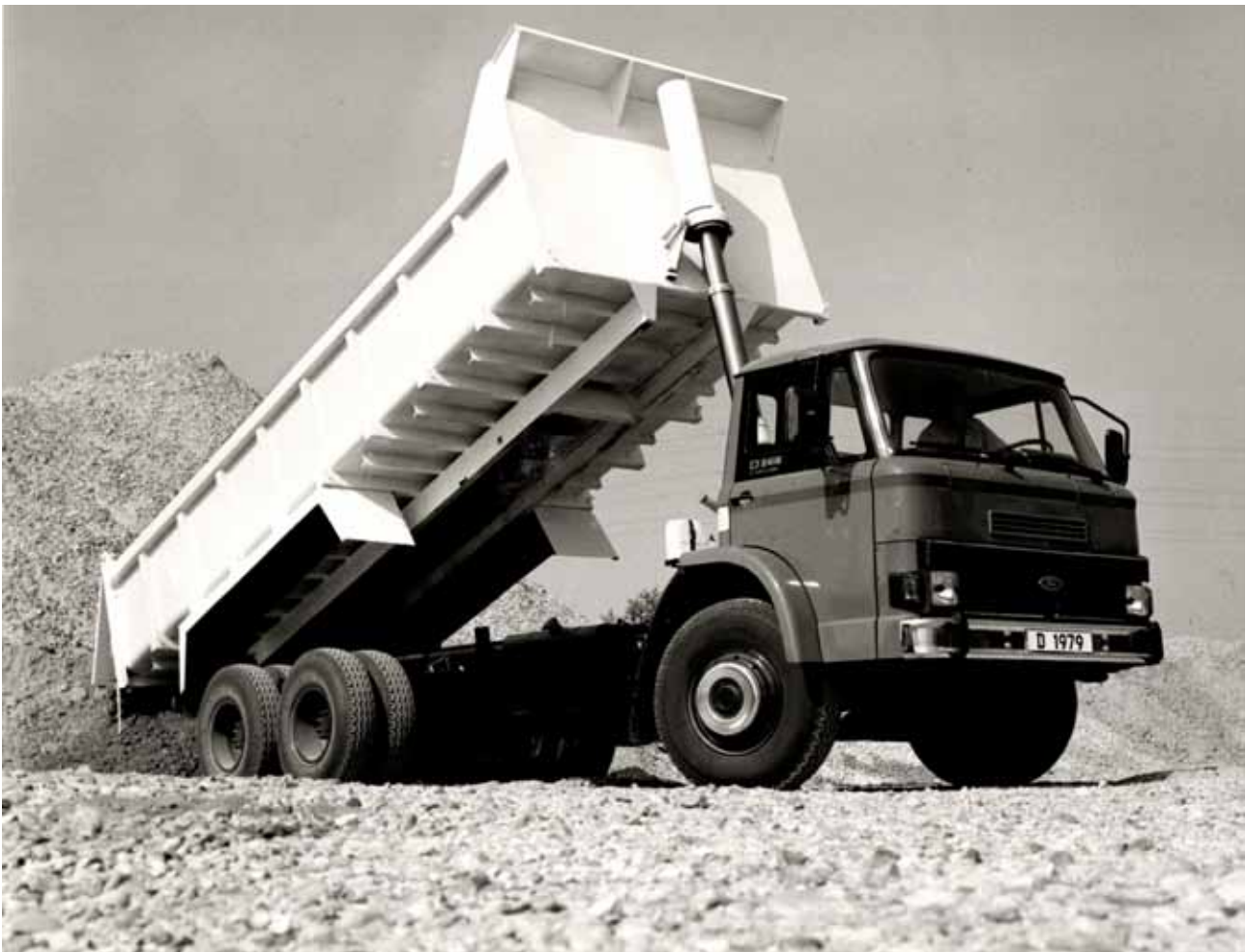
6x4 Tipper Een uitvoering van het 1979 modeljaar (herkenbaar aan de zwarte grille en vierkant koplampen), een D2418 met een Cummins V8 diesel van 8.3 liter en 126 kW in een 6x4 tipper uitvoering.

Ik heb dus uit de PR collectie een aantal foto's geselecteerd, die dit verder onderbouwen.