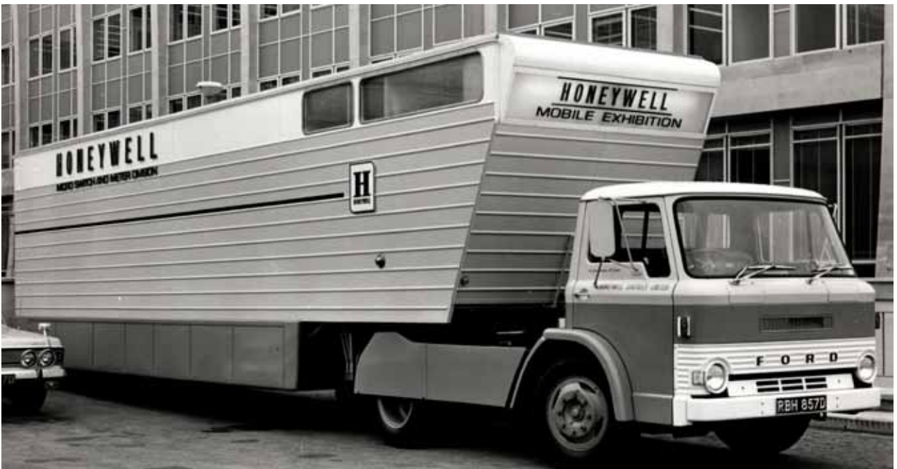
Demo Trailer: een D truck D 400 trekker met een speciaal ontwikkeld Mobile Exhibition trailer voor Honeywell