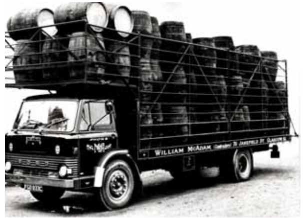
Whiskey een D 750 Custom aangepast voor het vervoer van de dagelijkse 160 vaten naar verschillende distilleerderijen