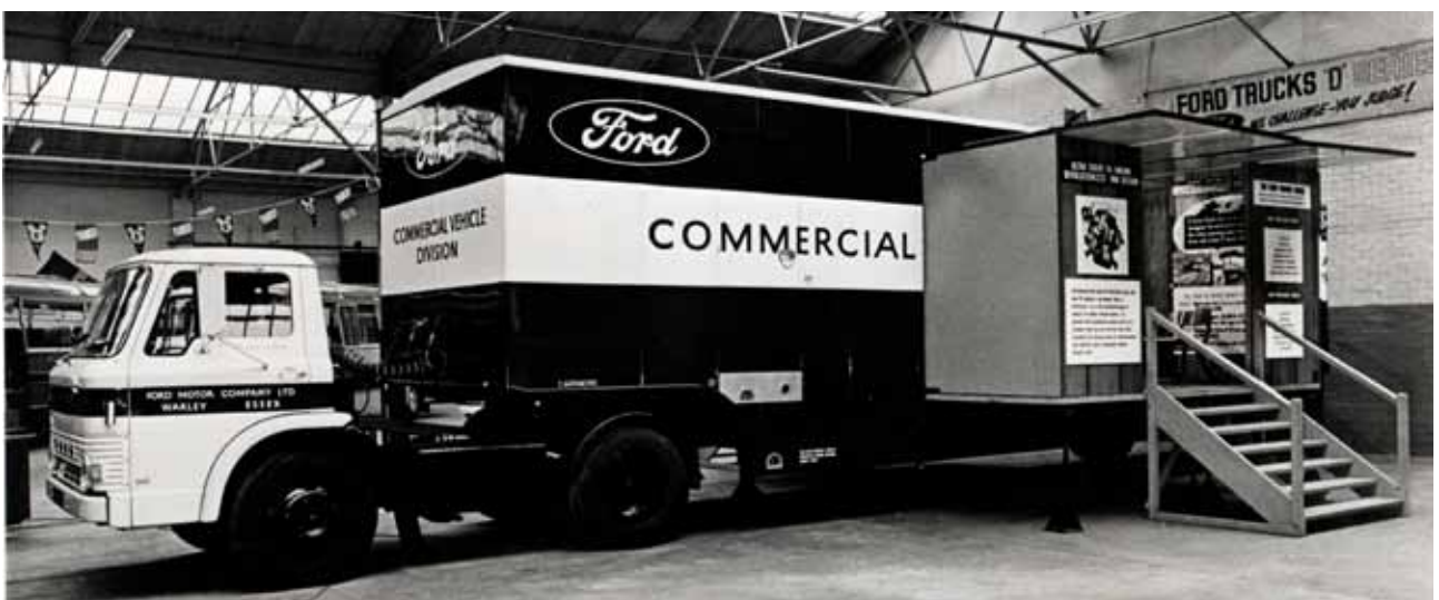
Mobile Exhibition Ford ontwikkelde voor eigen gebruik een speciale exhibition unit gebaseerd op een D800.