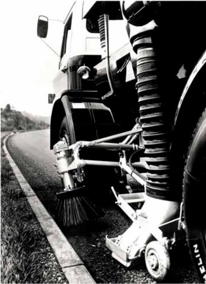
Roadsweeper Een veegmachine, roadsweeper in het Engels, hier bestaat ook een schaalmodel van. Gebaseerd op een D300 uitgerust met Johnston veegmachine equipment.