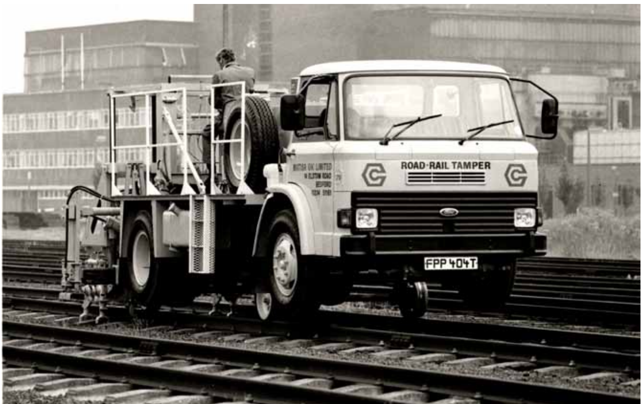
Trein Een aangepaste 1979 model uitvoering type D 1114, die ook op het spoor onderhoudswerkzaamheden kan verrichten.