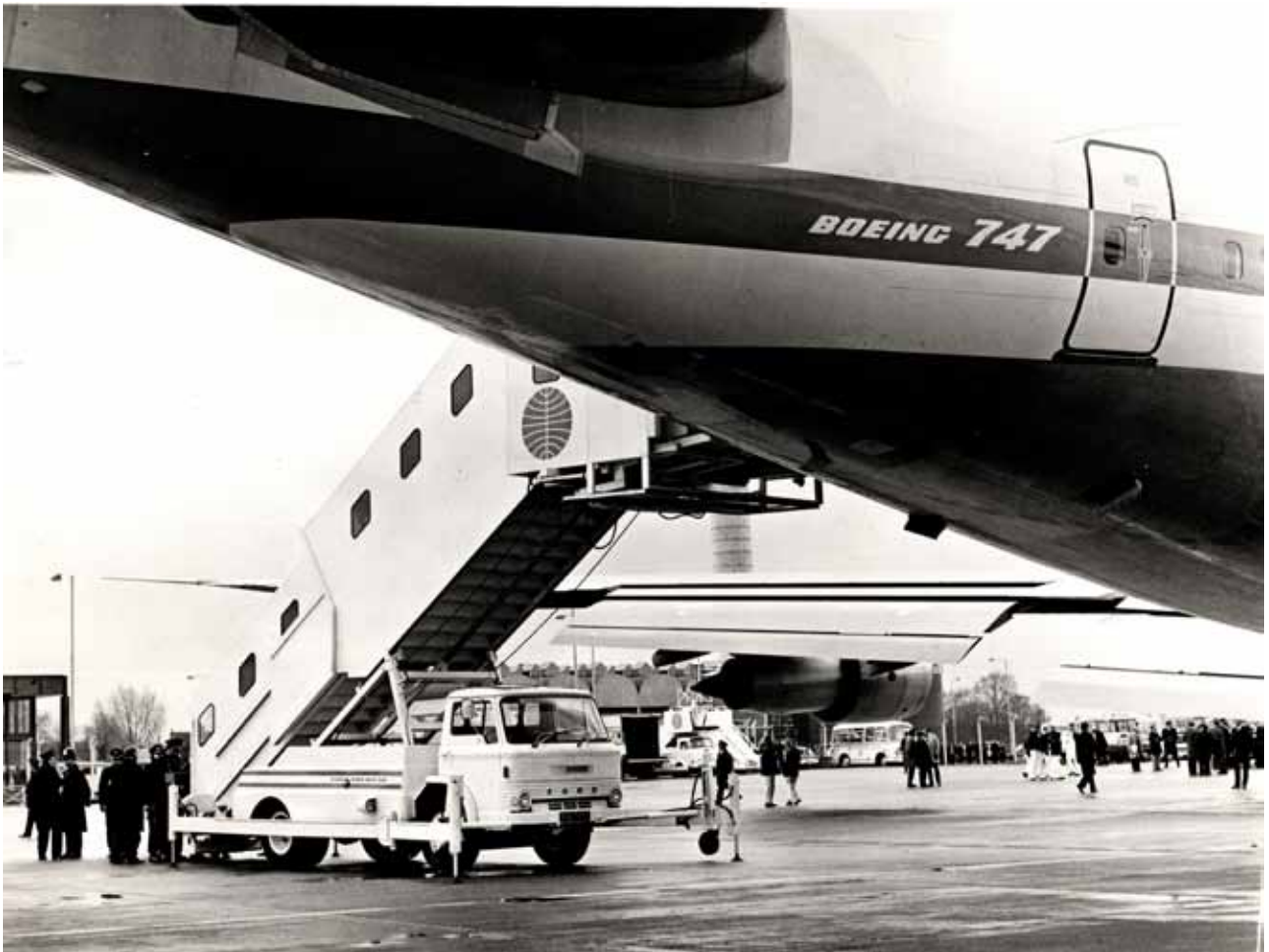
Trap: Een D 700 truck, aangepast om passagiers uit en in te laten stappen in b.v. grote vliegtuigen zoals een 747. De trap was zeer flexibel en kon tot 20 feet (ca 6 meter) omhoog. Let ook op de speciale steunen om de stabiliteit te waarborgen.