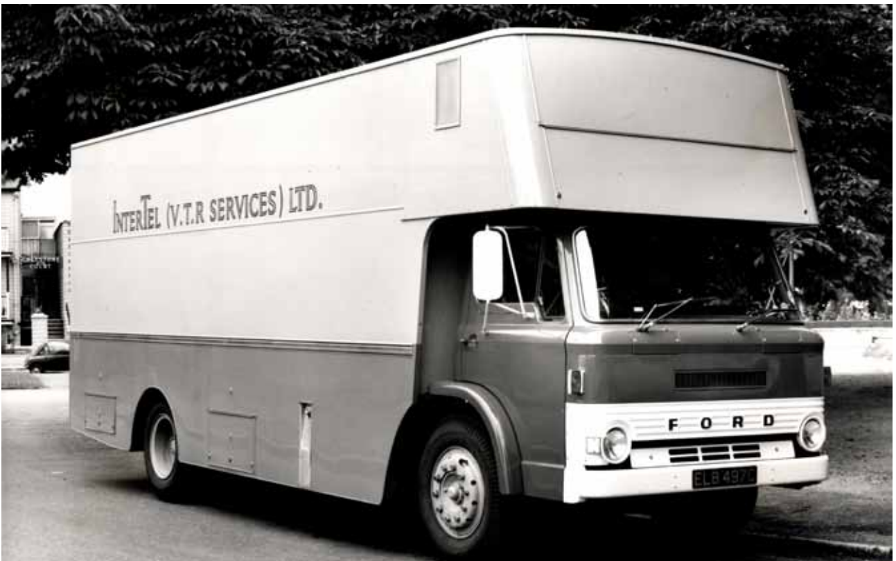
Box Een D800 met een airco (wie had dit in die jaren? met een Luton uitgerust als mobiele opnamestudio.